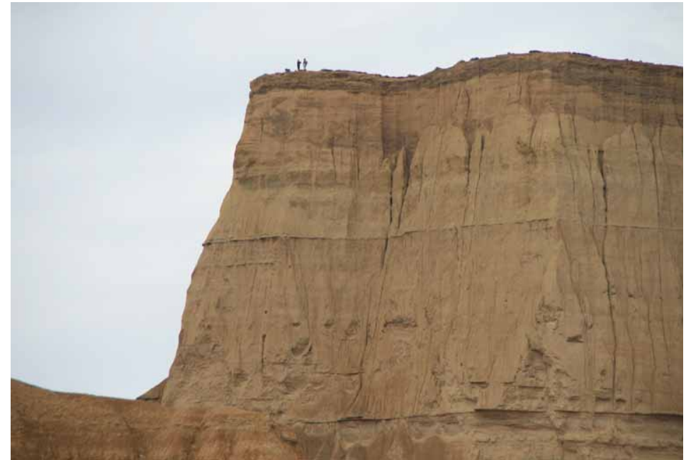
El Rallón