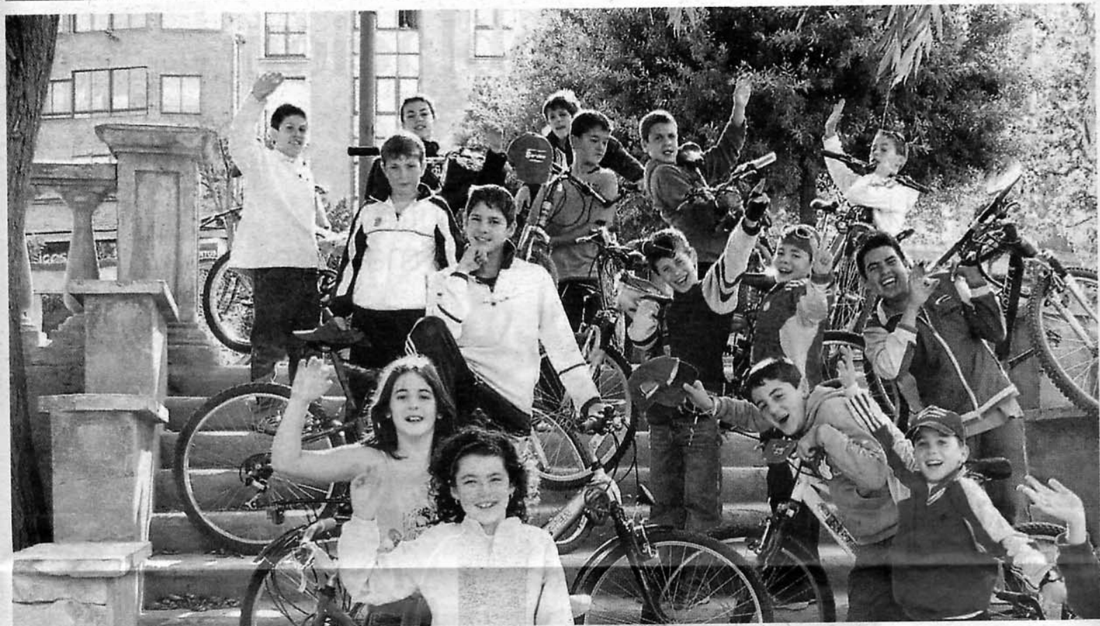
Unos jóvenes de la localidad de Corella que también participaron en esta 'Gran bicicletada'. ANSELMO DEL BARRIO