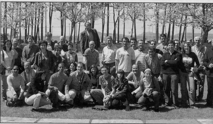
La final del certamen se celebró en Vigo.